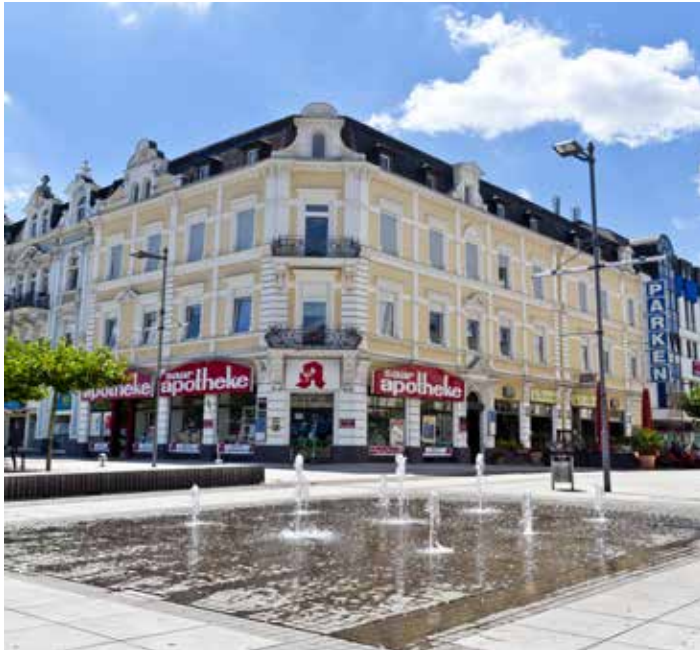
lanua G. P. S. mbH, Zweigstelle, Lothringer Straße 1 Innenstadt Saarlouis, direkt am kleinen Markt, 3. Stock barrierefrei