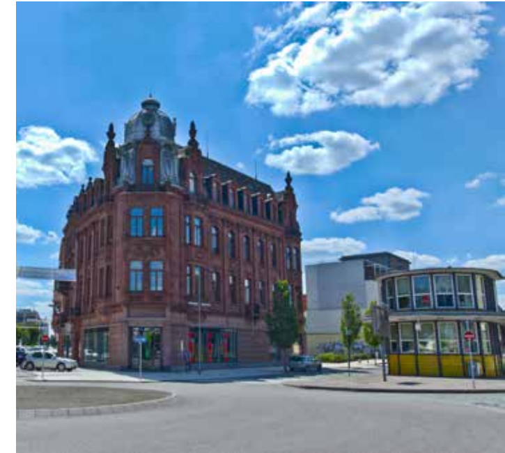
lanua G. P. S. mbH, Hauptstelle, Lisidorfer Straße 2 Innenstadt Saarlouis, direkt am Busbahnhof (kleiner Markt), 2. Stock Anlaufstelle für Erstkontakte